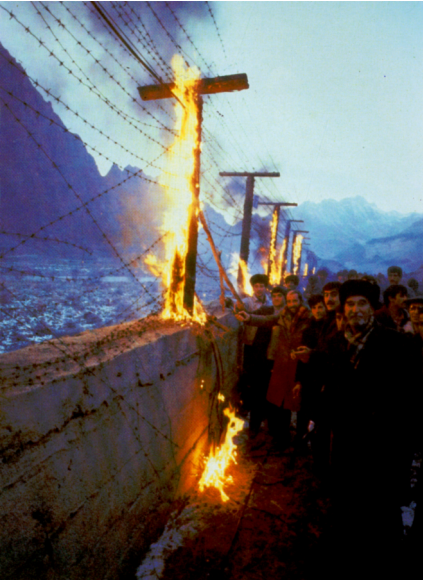
Birlik və həmrəylik günü بیرلیک وه وه همراي ليک گونو

۳۱ دئسامبر پارچالانمیش وطنیمیزین بیرلیک وه همراي ليک گونودور. بۇ ایل بۇ سرحد حرکاتیندان کئچیر. ۱۷ ایل قاباق سؤیشت مستملکهچنی سیستمی بشرلین دۇوارینین ییخیلماسیلا سارسیلیمیشدیر. بیزیم وطنداشلاریمیزدا چاغین آزادلیق سەسینی دۇیۇپ ، تاریخی مسؤلیتلیرینی دەرک ائدهرک ہمیللتیمیزین وه وطنیمیز آذەربایجانین یادلار الی ایله اؤرتاسیندان چکیلەن آزدي ۴. نجی بايراقدا ( صحيفه ده )