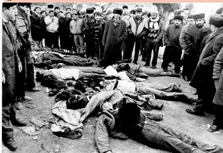
آردی ۲. نجی یاپراقدا (صحیفه ده)

بلی ۱۶ ایل بۇندان قاباق قۇزنی آذربایجانلی باجی - قارداشلاریمیز سۇن ۷۰ ایللیک رۇس مستملکسیندن قۇرتۇلماغا ، تیکرار اۆز مستقیللی یینی - باغلی سیزلیغینی (سووترئلی بیئی) الله ائتمهیه قالمخدیقا اۇرۇسلار اۆز مستملکچیلیک کاراکتئرلرینه وه خصوصیتلرینه وه دیکتاتورلۇق ماهییتلرینه گۆره بۇنا تحمول ائتمهیمهیب قۇئی آذربایجانلی اوچونجو دفعه اۇلاراق ایشغال ائتمهیه قۇزنی آذربایجاندا میللتیمیزین سسینی اۆز تانکلارینین تکرلری ائتیندا ازمهه چالیشلار. هاوادان ، دشمنده وه قۇرۇلۇقدان آذربایجانا سۇخۇلان اۇرۇسلارین قیزیل اۇرۇسۇنۇن تۆکدوکلری قانلار میللتیمیزین آزادلیغا اینامینی وه ایرادسینی سیندیرا بیلمدی. نهایت ۱۶۰ ایللیک رۇس مستملکچیلیینه سۇن قۇماغی باجاردی. میللتیمیزین آزادلیق وه مستقیللییه اولان اینامی