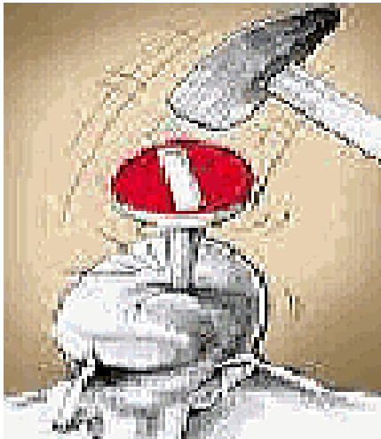
گوئی آذربایجاندا بیر کاریکاتور

آذربایجانچیلیق یۇخسا ایرانچیلیق وه بای بک سایینی Azərbaycançılıq yoxsa irançılıq və baybak sayıtı