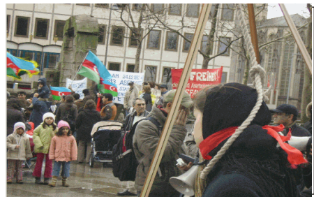
Freiheit für Azerbaijandische politische Gefangene im Iran!!!