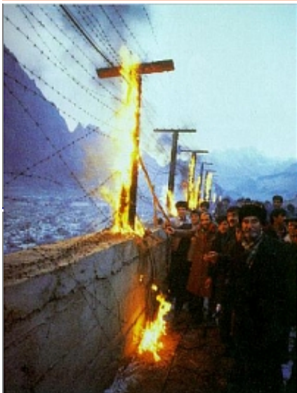
آزاي آیردیيارلار قوم ایله قاییردیيارلار

۳۱ دسامبر دنیا آذره رایجانلیلاری نین بیرلیک وه همراي ليک گونو 31 Desember Dünya Azərbaycanlılarının birlik və mərəyilik günüdür!