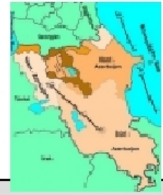
Ursprünglicher Grenzverlauf Azerbaijan