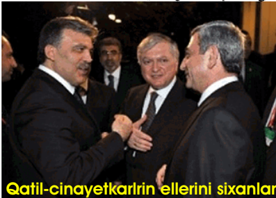
Qatil-cinayetkarin ellerini sixanlar

بۆیوک آتاتورکون دۆنیوی چیلیک اسایندا قۇردۇغۇ چاغداش تورکیینى ۷۰ ایلدن سۇنرا تورکییه میلیتىین دینی اینانچیلارینی اۆزونه آلت اندیب حاکمیییتی اله