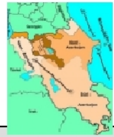
Ursprünglicher Grenzverlauf Azerbaijan