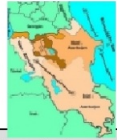
Ursprünglicher Grenzverlauf Azerbaijan