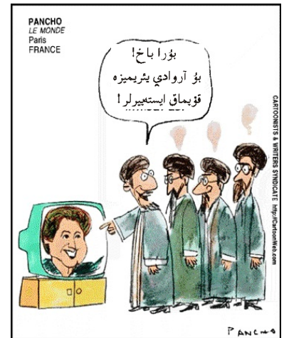
CARTOONISTS & WRITERS SYNDICATE Http:CartoonWeb.com

بیزه گۆره شیرین خانیم عبادیه نین سئچیلمه سی تصادوفی دئییلدیر . اؤنۇ ایران مۇخالیفتی نین باشینا گئیرمک ، آده ربایجاندا میلی حرکتی ضعیفله ده بیله ر . آده ربایجان میلیتی نین حاققاریندان وه اؤز طالعینی تعیین ائتمه باره ده دانیشدیغیمیزدا ، بئنده سیز ایراندا حاکمیتده سینیز دیهه بیلیرلر . بیزدن اۆلان بعضیلریده فارس شوؤنوزیمین و وه غریب اؤیۇنلارینا آلدانیب ، اؤیۇنا گله بیلیرلر . بۇنا گۆرده آده ربایجانلی آیدین وه صبیلالیلریمیز دیققلی اۆلمالیدیلرلر . خمیننی نین حاکمیتده گئیریلمه سینده ، خاتمی نین